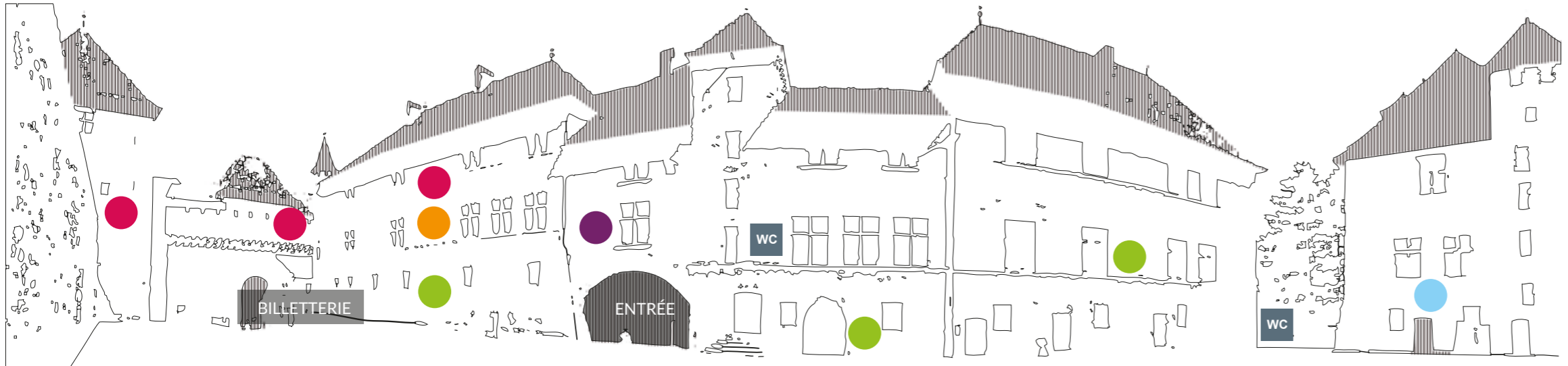
Tour de la Reine XIII e s. Logis Nemours XVI e s. Vieux Logis XIV-XV e s. Logis neuf XVI e s. Logis Perrière XV e s.

S'intégrant à la visite du Musée-Château, l'Observatoire Régional des Lacs Alpins (ORLA) constitue un ensemble de 700 m 2 d'exposition aménagé dans la Tour et le Logis Perrière. Il invite le visiteur à découvrir ces milieux complexes, fragiles et convoités que sont les lacs alpins à travers une muséographie originale qui s'articule autour de cinq domaines : la biologie, l'écologie, l'ethnologie, l'archéologie et la limnologie. L'Observatoire répond aux préoccupations d'une collectivité soucieuse de la qualité et de la préservation de son environnement. Il contribue à la mise en valeur et à la protection des milieux naturels alpins.