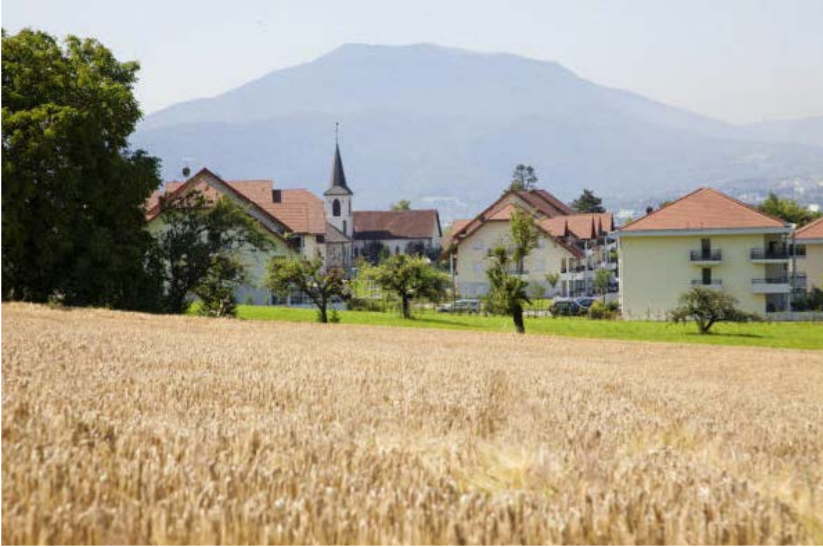
Pringy, chef lieu