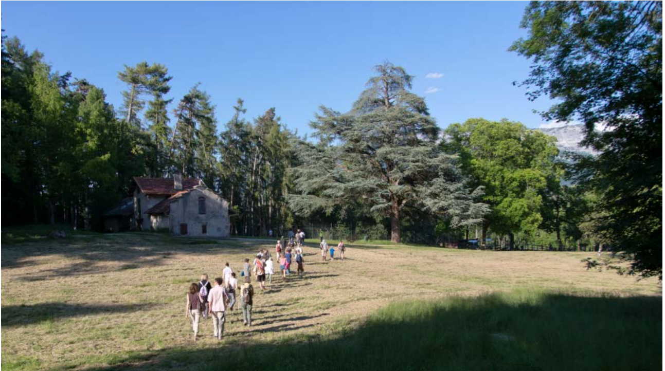
Sur le Semnoz