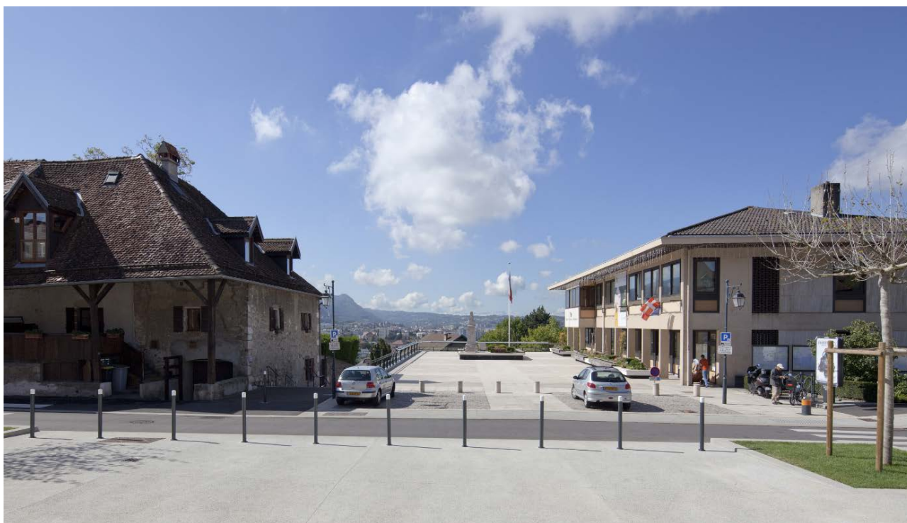
Esplanade de la mairie d'Annecy-le-Vieux