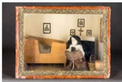
Cellule de clarisses, boîte de nonne, début 20e siècle - Chalons-sur-Saône, collection Trésors de ferveur