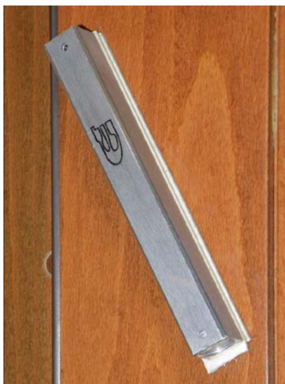
Mezouzah, objet du culte juif apposé au chambranle de l'entrée d'une demeure, collection particulière