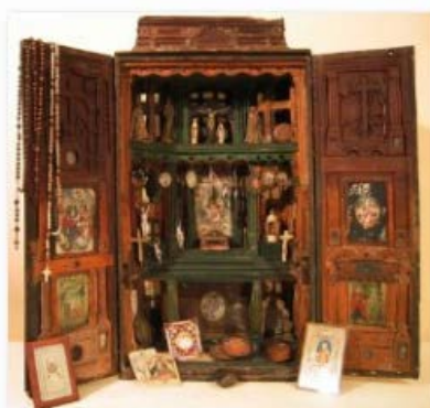
Boîte de colporteur, 17e siècle - Chalons-sur-Saône, collection Trésors de ferveur