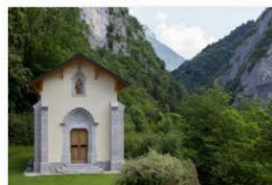
Dingy-Saint-Clair, Chapelle Sainte-Claire