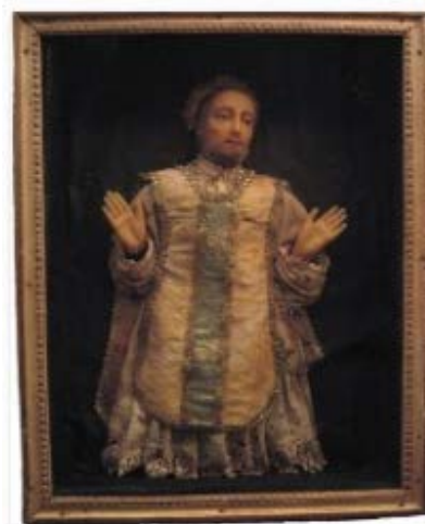
Cire habillée de Nancy, Saint Ignace de Loyola, 18e siècle - Chalons-sur-Saône, collection Trésors de ferveur