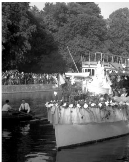
Annecy, arrivée au port de la statue de Notre-Dame de Boulogne-sur-Mer, septembre 1946 - Cliché Henri Odesser, collection Musées d'Annecy