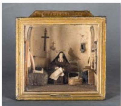
Cellule de carmélite, boîte de nonne, 19e siècle - Chalons-sur-Saône, collection Trésors de ferveur