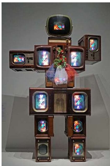
Olympe de Gougues, Nam June Paik, 1989

Art vidéo : forme d'art utilisant les vidéos comme support. Elles peuvent être modifiées ou non, assemblées, déformées selon la volonté de l'artiste.