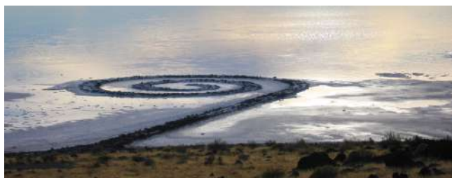
Spiral Jetty, Robert Smithson, 1970

Land art : mouvement artistique apparu dans les années 60 dans lequel les artistes intègrent leurs œuvres dans la nature. L'œuvre est éphémère et la photographie documente cette dernière, elle permet de garder une trace de celle-ci. C'est la photographie qui est exposée dans les musées.