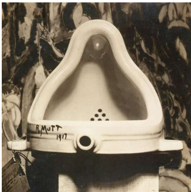
Fontaine, Marcel Duchamp, 1917

Ready made : employé par Marcel Duchamp dès 1916 au sens de "tout fait", le terme "ready-made" qualifie une production uniquement composée d'objets industriels préfabriqués. Dépourvus de leur fonction d'usage, signés et présentés à la façon d'œuvres d'art, ils font date par la radicalité du geste qui les sous-tend. "Aidés", c'est-à-dire assortis d'une signature, ou "rectifiés" par des inscriptions sibyllines ou potaches, ils sont dotés d'un titre allégorique qui engage un changement de fonction symbolique de l'objet, transformant l'urinoir en Fontaine.