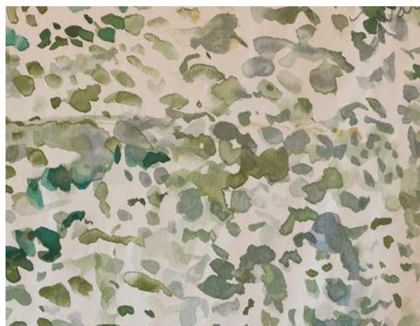
Détails de la tapisserie Le lac de Fabrice Hyber

Camaïeu : couleur déclinée en diverses nuances et utilisée dans une œuvre.