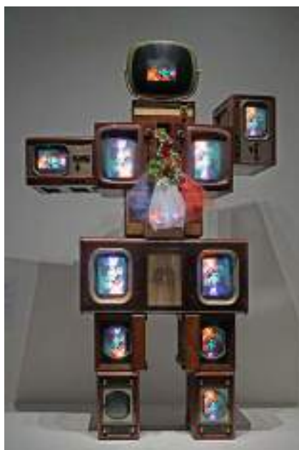
Olympe de Gougues, Nam June Paik, 1989

Art vidéo : forme d'art utilisant les vidéos comme support. Elles peuvent être modifiées ou non, assemblées, déformées selon la volonté de l'artiste.