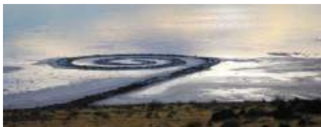
Spiral Jetty, Robert Smithson, 1970

Land art : mouvement artistique apparu dans les années 60 dans lequel les artistes intègrent leurs œuvres dans la nature. L'œuvre est éphémère et la photographie documente cette dernière, elle permet de garder une trace de celle-ci. C'est la photographie qui est exposée dans les musées.