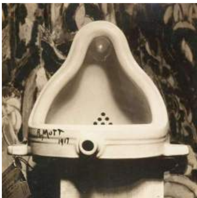
Fontaine, Marcel Duchamp, 1917

Ready made : employé par Marcel Duchamp dès 1916 au sens de "tout fait", le terme "ready-made" qualifie une production uniquement composée d'objets industriels préfabriqués. Dépourvus de leur fonction d'usage, signés et présentés à la façon d'œuvres d'art, ils font date par la radicalité du geste qui les sous-tend. "Aidés", c'est-à-dire assortis d'une signature, ou "rectifiés" par des inscriptions sibyllines ou potaches, ils sont dotés d'un titre allégorique qui engage un changement de fonction symbolique de l'objet, transformant l'urinoir en Fontaine.