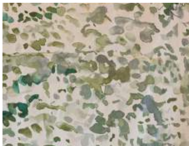
Détails de la tapisserie Le lac de Fabrice Hyber

Camaïeu : couleur déclinée en diverses nuances et utilisée dans une œuvre.