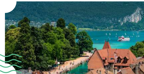
Jardins de l'Europe