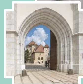
Aux portes du Château