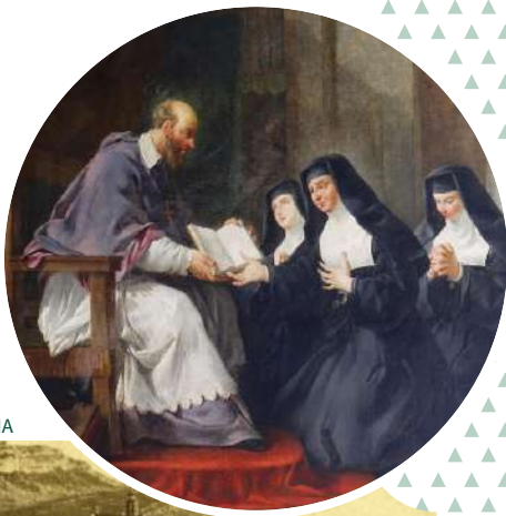
2 nd monastère de la Visitation

Saint François de Sales donnant à Sainte Jeanne de Chantal la règle de l'ordre de la visitation Noël Hallé - 18 e siècle