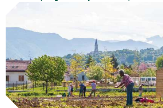
Jardins partagés de Vovray

Réservation conseillée au 04 50 33 87 34 ou sur reservation.animations@annecy.fr Venir en tenue décontractée, prévoir une couverture, un tapis et une bouteille d'eau.