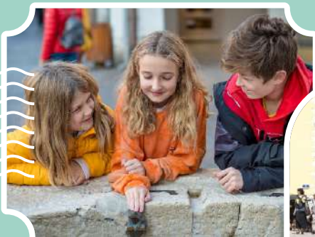
Enfants en vieille ville

Le territoire d'Annecy bénéficie du label national « Ville et Pays d'art et d'histoire » depuis 2004. Habitants, touristes, familles ou jeunes curieux, retrouvez toute l'année les activités proposées par le Service art et histoire d'Annecy. Embarquez avec un guide-conférencier pour des visites, des conférences, des parcours ludiques ou numériques, à la découverte des patrimoines matériel et immatériel, bâti, industriel et naturel du territoire.