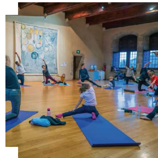
Art et yoga