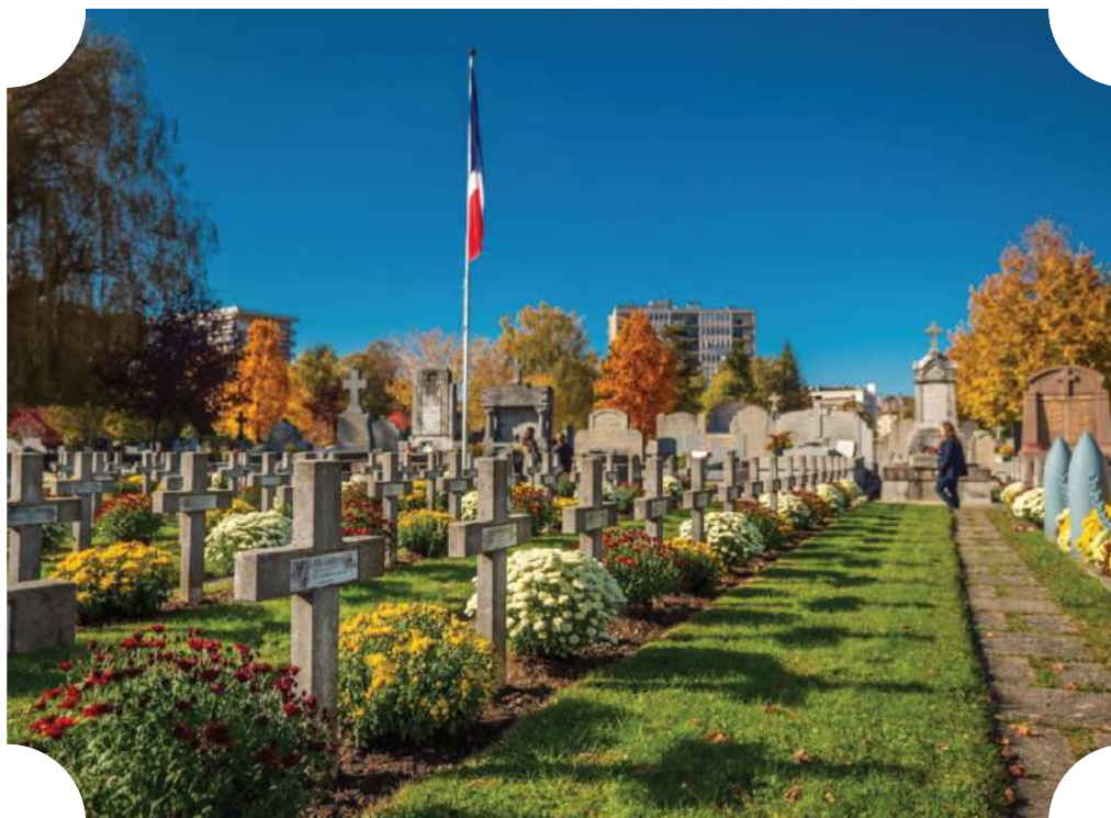
Cimetière de Loverchy