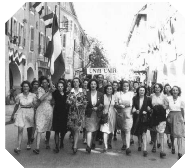
Défilé des prisonnières de l'école St-François libérées par les FFI © André Carteron, 19 août 1944 / ADHS, 7Fi1240