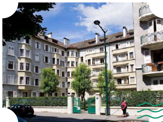
Immeuble HBM par Paul L. Coulin, rue Louis Revon

Découvrez deux figures de notre architecture locale qui ont marqué la ville d'Annecy au cours du 20 e siècle.