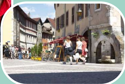
Vieille ville