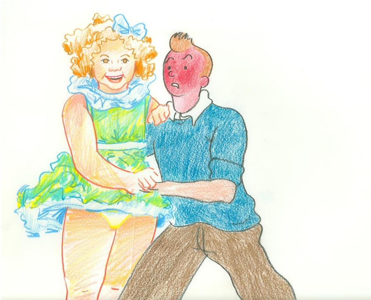
Pas à deux - Réalisation : Monique Renault & Gerrit Van Dijk, 1988 Dessin original du film, crayon de couleur sur papier Collection Musées d'Annecy