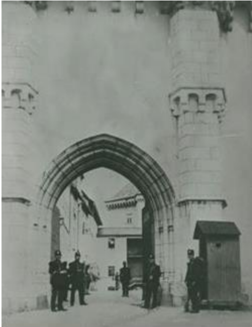
L'entrée du château est devenu une caserne.

Le château d'Annecy, sans fonction bien définie, aurait pu, comme bons nombres de châteaux-forts délaissés, être transformé en carrière de pierres, fournissant des matériaux "prêts à l'emploi" pour les chantiers en cours.