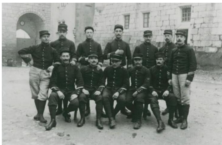
Groupe de militaire du 30 e régiment, de la 6 e compagnie posent dans la cour du château transformé en caserne

Avec la Réunion de la Savoie à la France en 1860, le vieux château conserve son rôle de casernement. En 1873, le 30 e régiment d'infanterie s'y installe. Henry Bordeaux, écrivain savoyard, découvre le château d'Annecy à l'occasion de son service militaire vers 1890. Il se souvient : "Il y avait beaucoup de punaises. Mais de la terrasse on voyait, le soir et le matin, de beaux spectacles : [...] des levers de soleil ou de lune derrière la Tournette et l'agitation des eaux sous les premières caresses de la lumière".