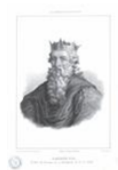
Le duc Amédée VIII

d'hommes en cas de guerre, ou pour prendre des résolutions après un grave incendie ou une disette. C'était aussi jusqu'au 15 e siècle le lieu où l'on rendait la justice. Au même niveau et juste au-dessus de la cuisine, la Chambre Rouge formait l'appartement privé des comtes de Genève. Deux tours assuraient la défense du Vieux logis ; l'une, la tour Saint-Pierre, possède encore sa couronne de créneaux, l'autre, la tour Saint-Paul, ses mâchicoulis.