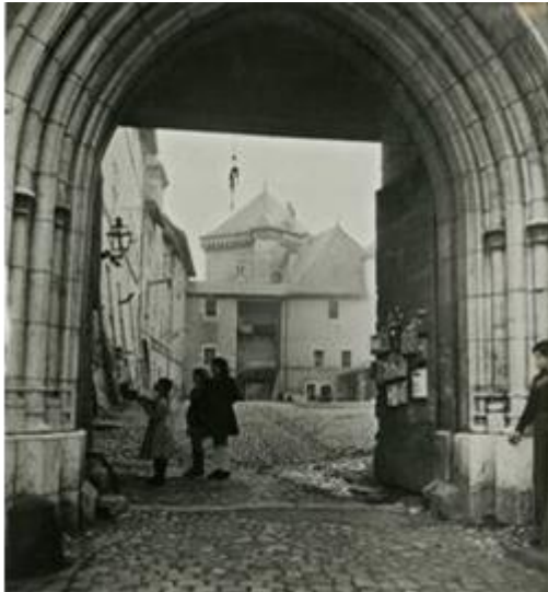
Les enfants des sans-logis à la porte d'entrée du château.

Le mur de soutènement de la terrasse Perrière s'effondre en 1946 ; la Ville qui avait le projet depuis la fin du 19 e siècle d'y transférer le musée bien à l'étroit à l'hôtel de ville, conditionne l'acquisition à la restauration du mur.