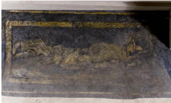
Décor peint représentant une vue du lac, de la ville et du château d'Annecy.

Le 16 e siècle voit l'édification du logis Nemours et du logis Neuf, tous deux construits par la famille des Genevois-Nemours. Charlotte d'Orléans, qu'un cousinage unissait à François 1 er , épouse Philippe, frère du duc de Savoie. En dot, le roi de France donne aux jeunes mariés l'apanage de Nemours situé en Île de