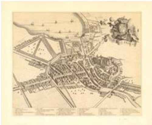
Theatrum Sabaudiae Annecy en 1690

On peut cependant relever la démolition au 18 e siècle du chemin de ronde entre la tour de la Reine et le logis Perrière et celui situé entre la tour Perrière et la tour Saint-Paul, ainsi que la disparition des bâtiments situés sur la terrasse Perrière, mentionnés dans de rares documents qui énuméraient une forge, un moulin à bras et une glacière offrant aux occupants du château la possibilité de conserver des aliments tout au long de l'année.