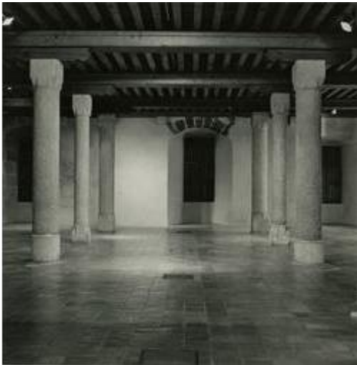
Salle des colonnes du musée-château en 1988

L'ancienne cuisine conserve deux imposantes cheminées et un four à pain situé au rez-de-chaussée de la tour Saint-Pierre, appelée aussi tour de la Bouteillerie.