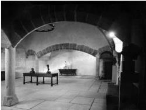
L'ancienne cuisine du château restaurée

Le Vieux logis Le Vieux logis est construit au 13 e siècle sur le côté nord de l'escarpement, par les comtes de Genève dont cinq générations se succèdent jusqu'à l'extinction de cette dynastie en 1394.