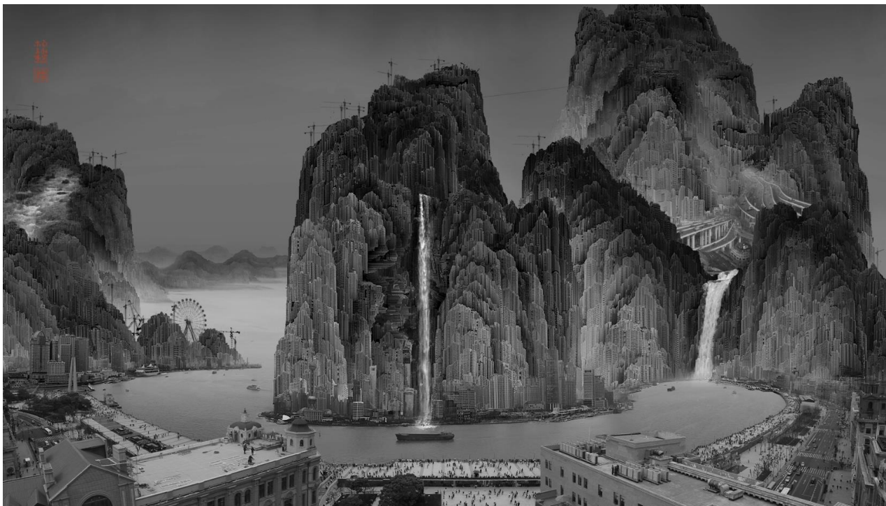
Yang Yongliang, Before the rain , 2010

Pour clore cette partie, l'artiste contemporain Ye Linghan, qui utilise également le lavis animé, introduit un questionnement sur la permanence de cette tradition.