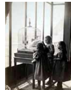
Les enfants jouent avec Pollet le perroquet Fin XIX e début XX e siècle