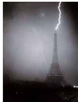
L'éclair frappe la tour Eiffel Fin XIX e siècle