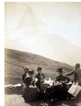
Détente à l'hôtel Riffelberg, Zermatt Fin XIX e siècle