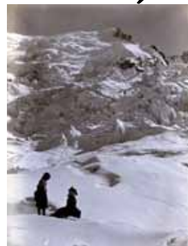
Pause sur le glacier des Bossons Fin XIX e siècle