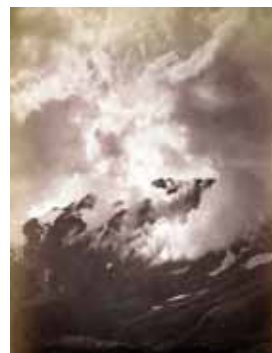
Effet de nuage au Breuil Fin XIX e siècle