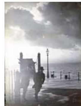
Sur les quais à Liverpool Fin XIX e siècle