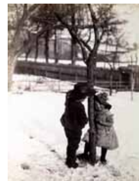
Partie de boules de neige Fin XIX e siècle