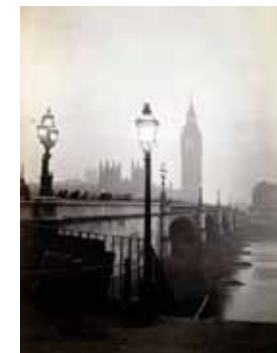
Westminster Bridge par brouillard Fin XIX e début XX e siècle