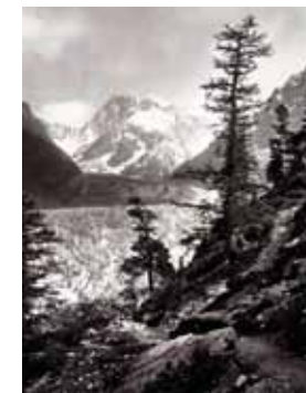
La Mer de Glace et les Grandes Jorasses Fin XIX e siècle