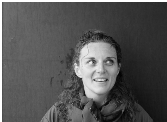
Portrait de l'artiste