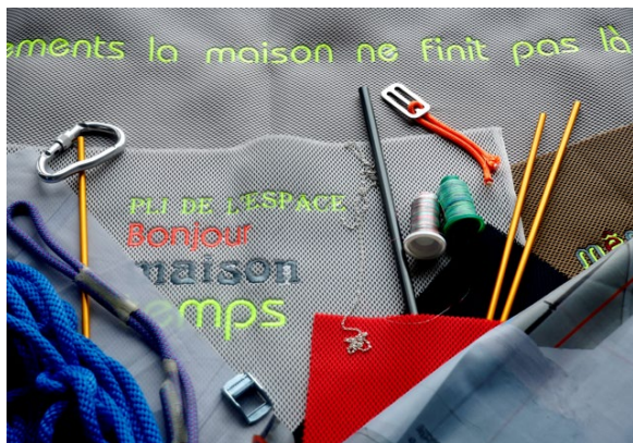
Maison sans murs 300622 / Julie Kieffer