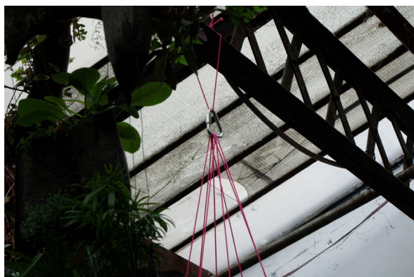
Maison sans murs 300622 (détail) / Julie Kieffer © Julie Kieffer