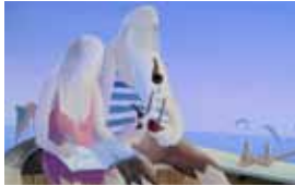
2. Document original du film La Traversée de l'Atlantique à la rame - Réalisation, décors et animation : J.-F. Laguionie, 1978 - Production : Institut national de l'audiovisuel, Mediane Films - Film d'animation court-métrage de 21 min.