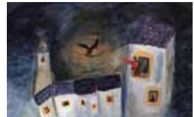
9. Document original du film Le Masque du Diable - Réalisation et scénario : Kali Carlini et J.-F. Laguionie, 1976 - Production : Mediane Films, Corona Cinematografica de Rome - Film d'animation court-métrage de 11 min. 40 s.