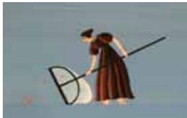
5. Document original du film La Demoiselle et le Violoncelliste - Réalisation : J.-F. Laguionie, 1965 - Production : Les Films Paul Grimault et Service de la Recherche de l'ORTF - Film d'animation court-métrage de 9 min. - Grand Prix du Festival d'Annecy en 1965