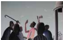
11. Document original du film Une Bombe par hasard - Réalisation : J.-F. Laguionie, 1969 - Production : Les Films Paul Grimault - Film d'animation court-métrage de 7 min. 26 s.