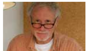
12. Portrait de Jean-François Laguionie