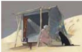
8. Document original du film Louise en hiver - Réalisation : J.-F. Laguionie, 2016 - Production : JPL Films, ARTE France Cinéma, L'Unité centrale (Canada) - Film d'animation long-métrage de 75 min.