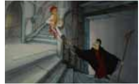
3. Document original du film Le Château des singes - Réalisation : J.-F. Laguionie, 1999 - Production : Les Films du Triangle, La Fabrique, FR3, Steve Welsh production, Cologne Cartoon, Kecskemet Films, Ventureworld Films - Film d'animation long-métrage de 75 min.