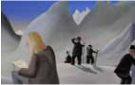
1. Document original du film L'Arche de Noé - Réalisation : J.-F. Laguionie, 1966 - Production : Les Films Paul Grimault, avec le concours du Service de la Recherche de l'ORTF - Film d'animation court-métrage de 10 min.