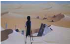
4. Document original du film Gwen, le livre de sable - Réalisation : J.-F. Laguionie, 1984 - Production : Les Films de la demoiselle, Les Films A2, en association avec le ministère de la culture - Film d'animation long-métrage de 67 min.