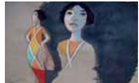
6. Document original du film Le Tableau - Réalisation : J.-F. Laguionie, 2011 - Production : Blue Spirit Animation, Be-Films, uFilm - Film d'animation long-métrage de 76 min.