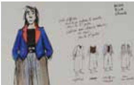
7. Document original du film L'Île de Black Mór - Réalisation : J.-F. Laguionie, 2004 - Production : Les Films du Triangle, La Fabrique, Producteurs associés TEVA - Film d'animation long-métrage de 85 min.