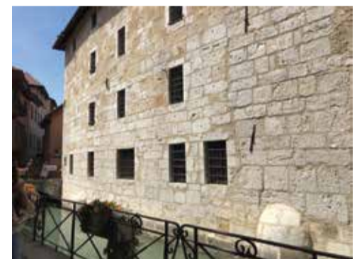
Aile de la Monnaie

Suite à la décision du Sénat de Savoie d'interdire aux magistrats d'officier dans leur maison, des bureaux dénommés « banches » sont construits. Ils prolongent le Palais de l'île. Ils accueillent des bureaux où se traitaient les affaires, les contrats et les conciliations.