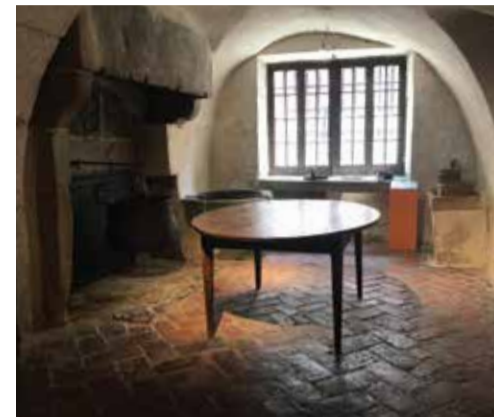
La cuisine du geôlier