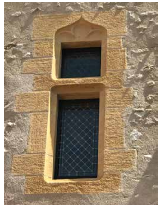
Détail d'un arc en accolade

En 1865, à la suite du rattachement de la Savoie à la France, une nouvelle prison s'ouvre à Annecy et accueille les prisonniers. L'ancien bâtiment devient asile de vieillards de 1865 à 1880. Jusqu'à son classement comme monument historique en 1900, le Palais de l'Île est menacé de destruction. Cependant, des voix s'élèvent progressivement contre.