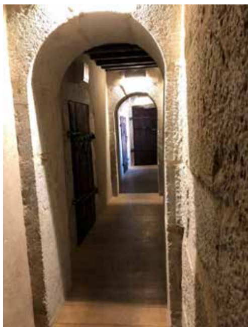
Cachots au Palais de l'Île

En 1403, à la suite de la mort sans descendance du dernier comte de Genève, le territoire du Comté de Genève est annexé à la Savoie. La maison est acquise en 1473 par Janus de Savoie, petit-fils du duc Amédée VIII de Savoie.