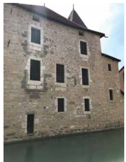
Aile de la maison