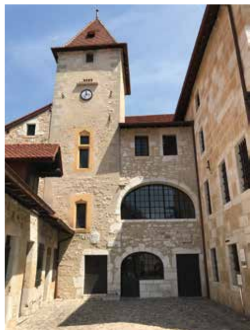
Façade de la cour d'entrée