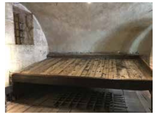
Un cachot

De 1928 à 1981, l'ancienne chapelle du Palais de l'île est affectée au culte de la communauté orthodoxe d'Annecy. Elle accueille aujourd'hui des présentations temporaires d'artistes qui travaillent sur les notions d'espace, d'architecture ou de paysage.