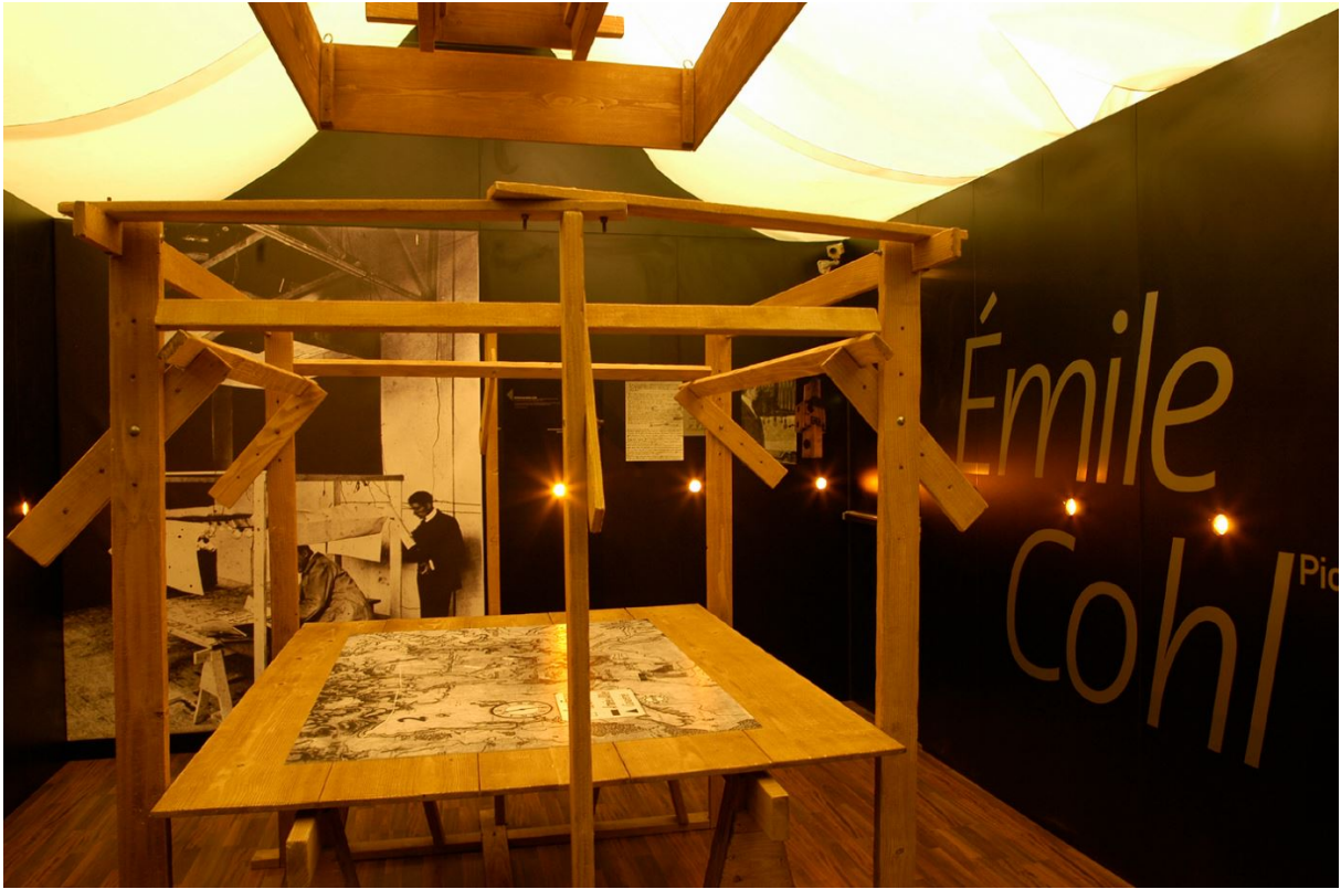
Musée du film d'animation