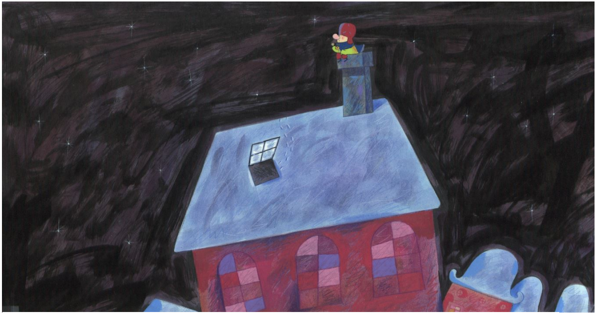
L'enfant au grelot - Réalisation Jacques-Rémy Girerd, 1997 - Production Folimage - Document original du film, collection Musées d'Annecy