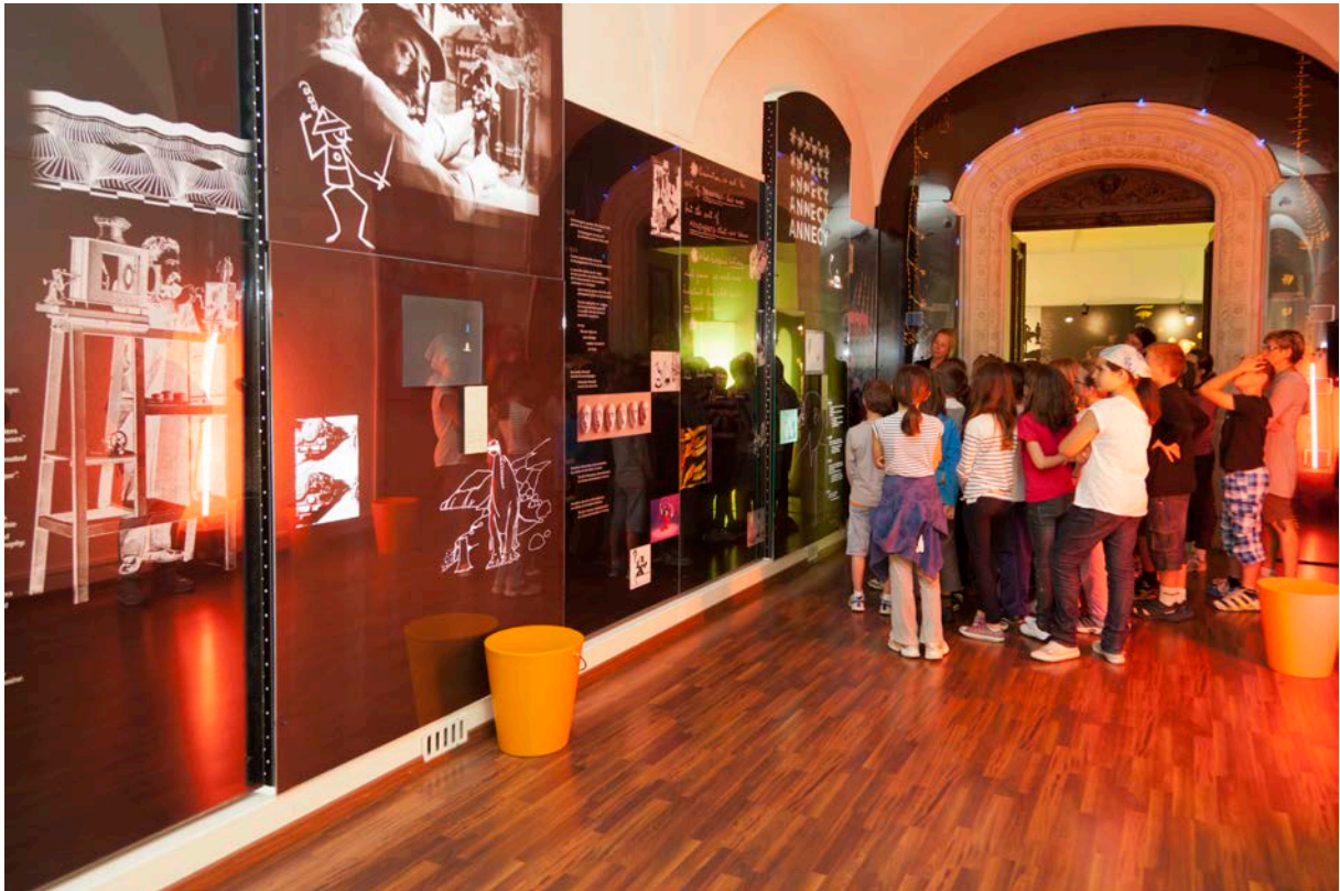
Musée du film d'animation