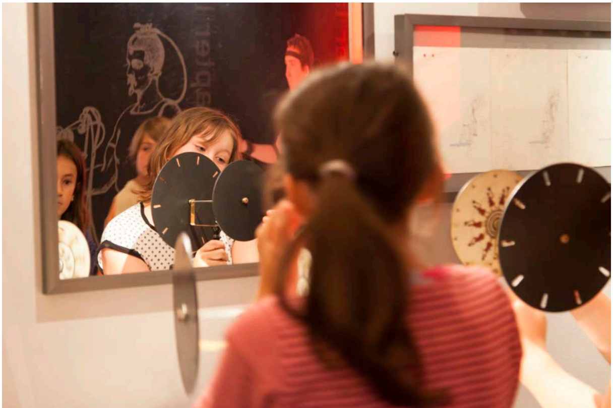
Musée du film d'animation