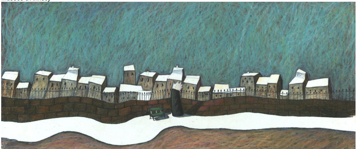
Les Tragédies minuscules - Si tu savais ce que j'en pense (épisode 10) - Réalisation Alain Gagnol et Jean-Loup Felicioli, 1999 - Production Folimage - Document original du film, collection Musées d'Annecy