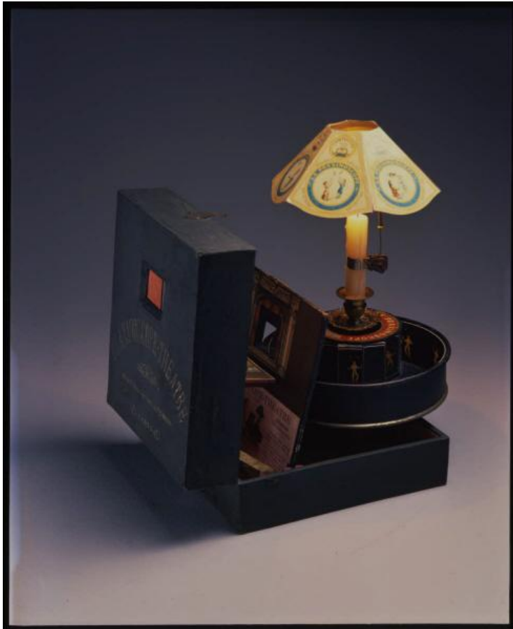
Praxinoscope théâtre Auteur de l'œuvre : Emile Renaud Cylindre en métal, bougeoir, porte abat-jour d'origine avec bandes fond noir et décors Dans le coffret, bois gaine en tissu vert (piste de cirque -, effet neige).

Cette partie de la collection met en évidence le cheminement scientifique et technique qui a conduit à la maîtrise de la projection des images et de la synthèse du mouvement. Elle regroupe des objets ayant contribué à l'invention du cinéma, de la lanterne magique au théâtre optique. Elle comprend également des jouets d'optiques et appareils de projection plus récents dans la mesure où ils constituent l'aboutissement, la continuité (voire la forme dégénérée) des premiers systèmes d'analyse et de synthèse du mouvement. Elle comprend enfin l'imagerie liée à ces appareils.