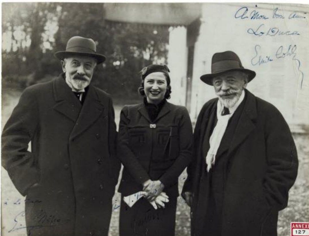
Georges Méliès, Leontina « Mimma » Indelli, Emile Cohl © Lo Duca, Joseph-Marie L'unique rencontre entre Emile Cohl (à droite) et Georges Méliès, sous l'initiative de Lo Duca qui avait amené Emile Cohl à la maison de retraite des artistes d'Orly en 1936.