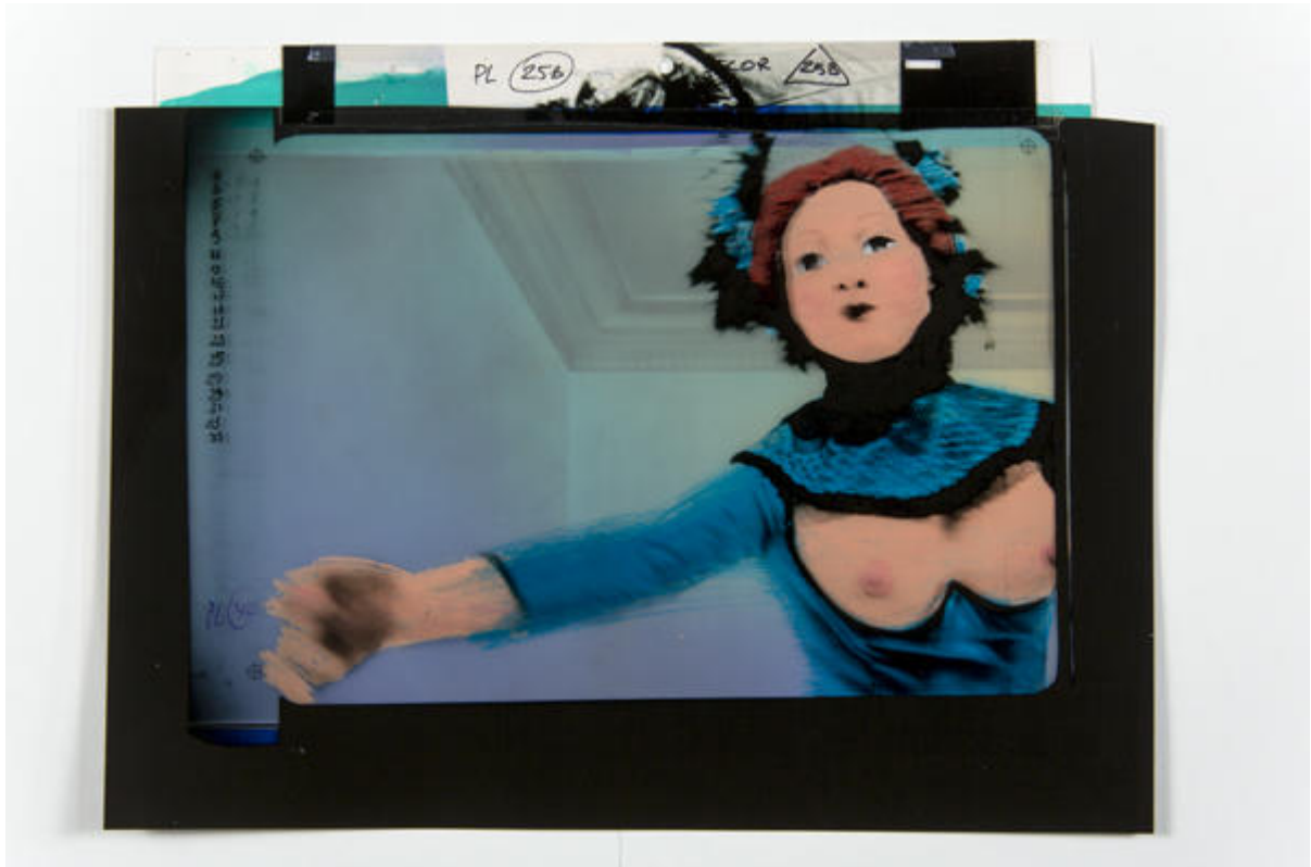
Nachtlinders (Papillons de nuit), 1998 Auteur de l'œuvre : Raoul Servais, © Denis Vidalie Décor en Servaisgraphie (25B) et phase d'animation en Servaisgraphie superposés.

En 2011, un ensemble d'œuvres de Raoul Servais est venu enrichir les collections de cinéma d'animation des musées de l'agglomération d'Annecy. Dans cet ensemble, des documents originaux de deux films essentiels du cinéaste, « Taxandria », long-métrage sorti en 1994, et « Papillons de Nuit », court-métrage de 1998, témoignent d'un procédé artistique et technique exceptionnel : la Servaisgraphie. Ce troisième ouvrage de la collection Les animés est l'occasion de rendre compte de l'invention de Raoul Servais tout en présentant l'ensemble des documents originaux des films de cet artiste actuellement conservés au Musée-Château d'Annecy.