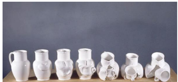
Naissance - Auteur de l'œuvre : Svankmajer Jan, © Eclipse Suite cinématique en céramique (8 pièces) représentant la naissance d'une tasse à partir d'une cruche.

Dans cet ensemble, nous distinguons une cinquantaine d'œuvres plastiques indépendantes des films d'animation, mais directement liées à l'animation (par exemple une sculpture cinétique) ou réalisées par un cinéaste, en marge de son œuvre cinématographique.