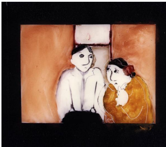
The Street. Auteur de l'œuvre : Caroline Leaf, © Denis Vidalie - Peinture sur plaque de verre réalisée par l'artiste d'après le film et illustrant une journée de travail.

Cette partie regroupe les documents originaux de films d'animation (dessins, décors, volumes, marionnettes, objets divers...). Ces objets sont les témoins matériels de la réalisation des films d'animation. Ils sont révélateurs des techniques utilisées, mais aussi du processus de création des films.