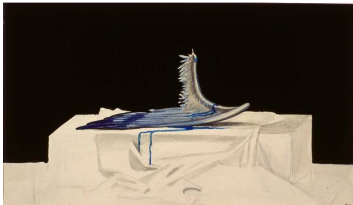
Les jeux des anges - Auteur de l'œuvre : Borowczyk Walerian, Une aile blanche et bleue d'où sort un filet de sang bleu est posée sur un socle recouvert d'un drap blanc.