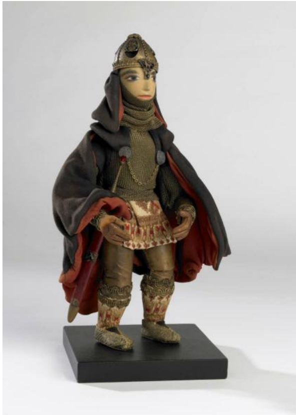
Les vieilles légendes tchèques Auteur de l'œuvre : TRNKA, Jiri, © Eclipse