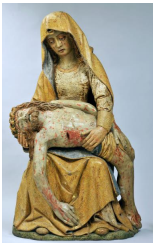
3 : Savoie, Pietà , bois polychrome, après 1494, Aoste, Museo del Tesoro della Cattedrale , inv. BM 377