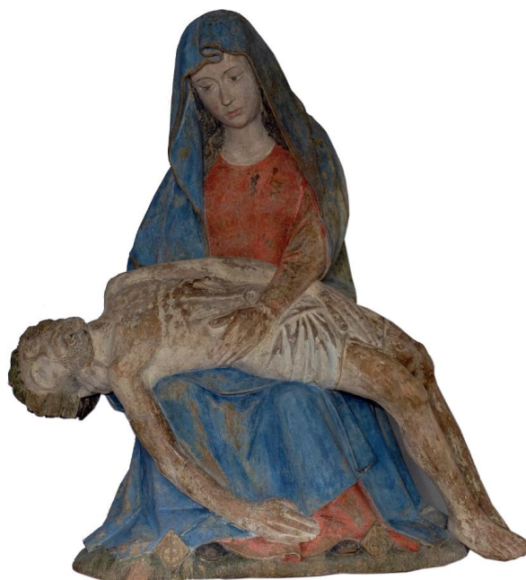
8 : Savoie, Pietà , bois (noyer) polychrome, vers 1500, Collection de l'Académie florimontane, Château de Montrottier, inv 2342.