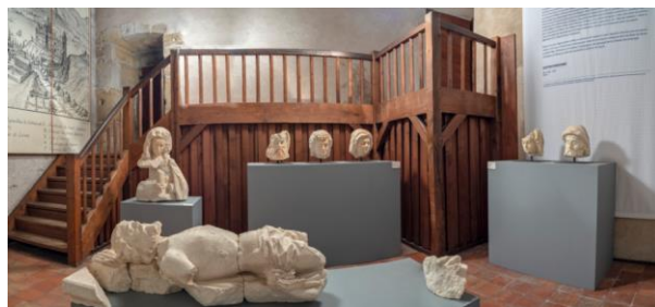
6 : Sculpteur bourguignon, Mise au tombeau, pierre, provenant de l'église du Saint-Sépulcre d'Annecy, v. 1440-1450, collection des musées d'Annecy, inv. 13559