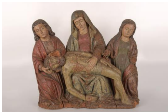
4 : Savoie, Pietà entre saint Jean et sainte Marie-Madeleine , bois (noyer) polychrome, début du XVIe siècle, Collection de l'Académie florimontane, Château de Montrottier, inv 2349