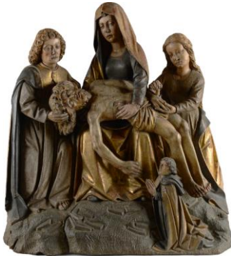
1 : Savoie, Pietà entre saint Jean et sainte Marie-Madeleine , bois (noyer) polychrome, dernier quart du XVe siècle, autrefois conservée dans l'église de Saint-Offenge-Dessus, Chambéry, Musée Savoisien (dépôt de la commune de Saint-Offenge-Dessus).