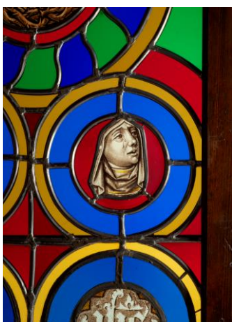
7 : Savoie (?), Vierge de douleur, vitrail (verre, peinture en grisaille et plomb), fin du 15 e siècle, collection des musées d'Annecy, inv. 2011.0.1044