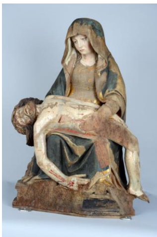
5 : Savoie, Pietà , bois (noyer) polychrome, 1 er quart du XVI e siècle, Yenne, autrefois conservée dans la chapelle du Petit-Lagneux, Chambéry, dépôt de la commune au Musée Savoisien