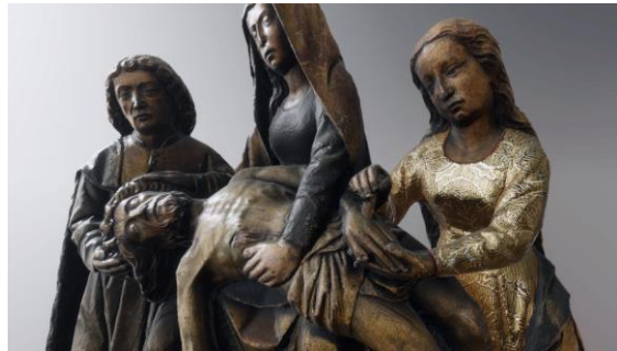
2 : Hypothèse de restitution colorée et texturée du décor en brocarts appliqués continus de la robe de la sainte Marie-Madeleine de la Pietà de Saint-Offenge